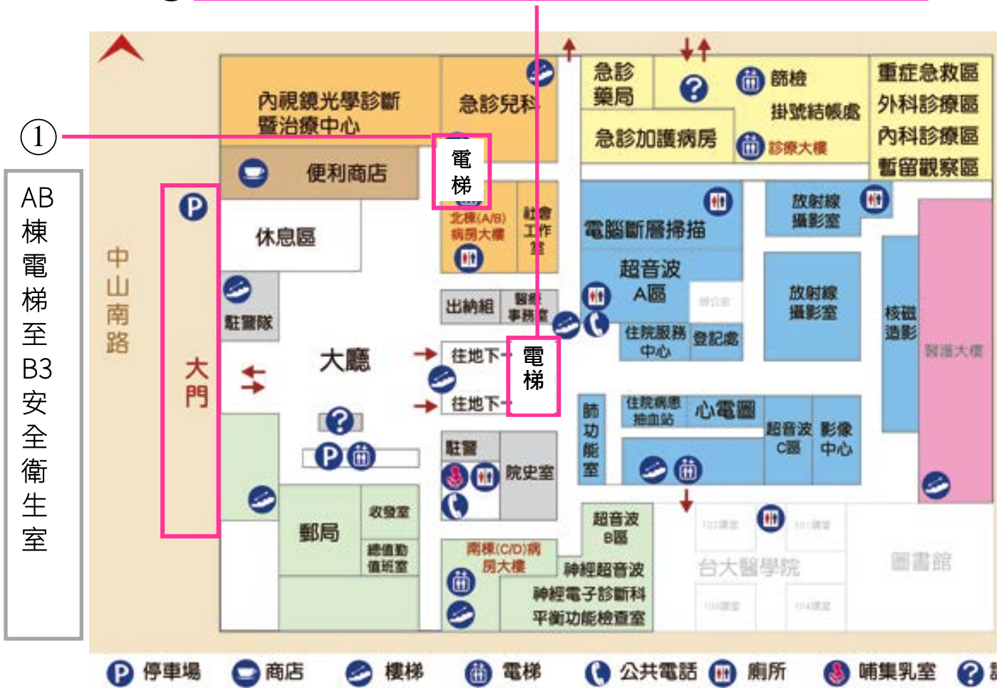
台大醫院院東址一樓室內平面圖