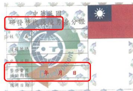
研發替代役身分證正面 (役政署印製)