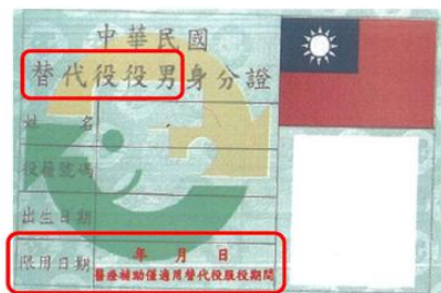
一般替代役身分證正面 (役政署印製)

(二)一般替代役役男身分證有效期限以註記之『限用日期』為準；研發替代役役男身分證有效期限以註記之『醫療費用補助期限』為準。