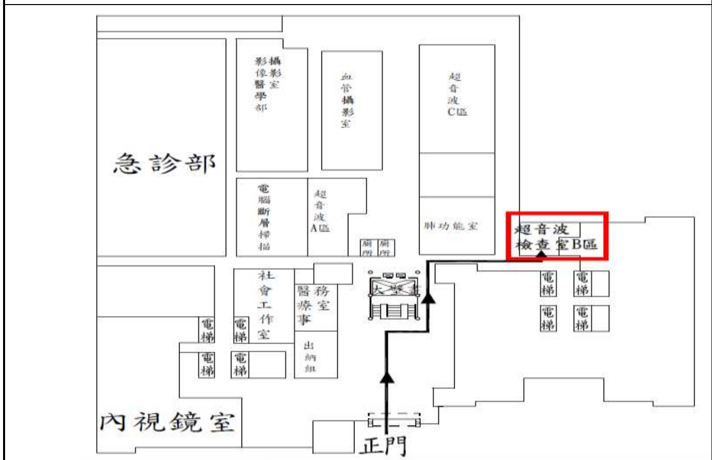
中山南路 7 號 東址一樓 超音波 B 區