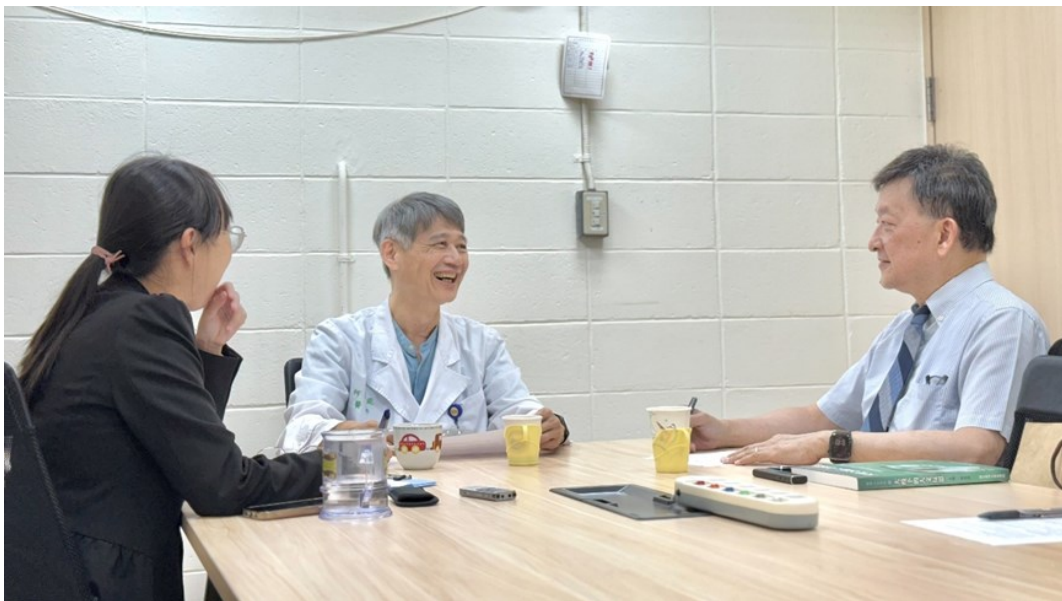
圖二 何教授分享過去臺大醫院與研究倫理相關的趣聞

何教授指出 FERCAP 評鑑較像是臺灣的醫策會評鑑，屬於條列式確認是否符合規範；而 AAHRPP 評鑑則具有輔導性，考量不同國家的文化與法律差異，評鑑內容也更全面，對提升研究倫理制度的成熟度具有重要意義。