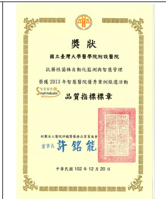
感染控制中心，抗藥性菌株自動化監測 與智慧管理：「標章」