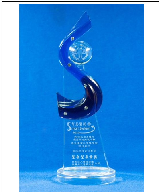
遠距中心，遠距照護資訊整合：「獎座」