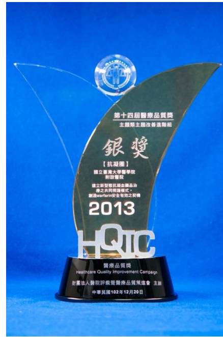
建立新型態抗凝血藥品治療之共同照 護模式，創造 warfarin 安全有效之契 機，主題改善進階組：「銀獎」