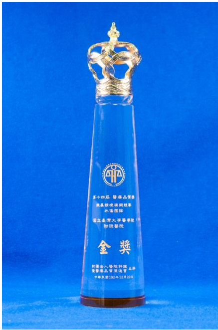
急診醫學部， 擬真情境競賽-外傷團隊組：「金獎」