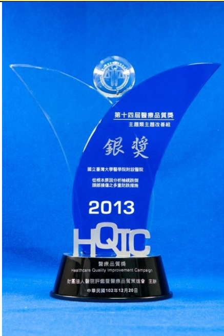
從根本原因分析檢視跌倒頭部損傷之 多重防跌措施，主題改善組：「銀獎」