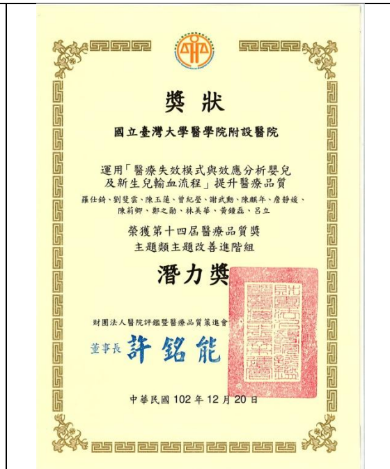
運用「醫療失效模式與效應分析嬰兒及 新生兒輸血流程」提升醫療品質，主題 改善進階組：「潛力獎」