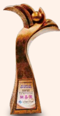
▲ 運用流程改造與跨單位整合縮短急救復甦後低溫治療到達目標溫小於 360 分鐘