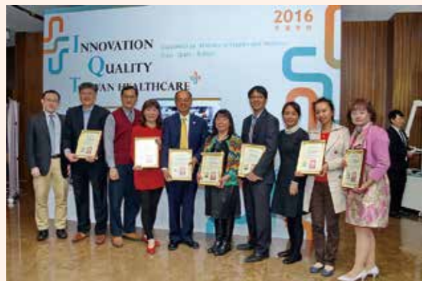
▲ SNQ 受獎團體合照