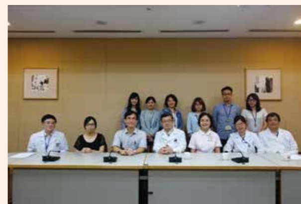
▲ 羅東博愛醫院參訪