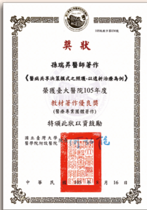
▲ 「醫病共享決策模式之照護 - 以透析治療為例」獲得教材著作優良獎