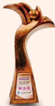
▲ 運用團隊資源管理於降低給藥異常事件數之成效探討