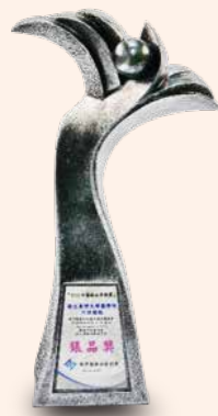
▲ 運用醫療失效模式與效應分析提升呼吸器使用病人運送與檢查安全 (銀獎)