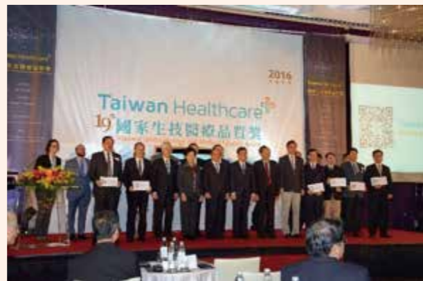
▲ 本院 SNQ 團隊 3 組醫療照護團隊（小兒心臟、心臟外科、生殖醫學）參加生策會 Taiwan Healthcare+ (THP) 國際行銷平台 (12/23)，SNQ 頒獎典禮中林明燦副院長（第一排左邊第一位）代表台大醫院參與開幕儀式（參與活動成員中有陳建仁副總統、王金平委員、張博雅委員、陳維昭委員等人合影）