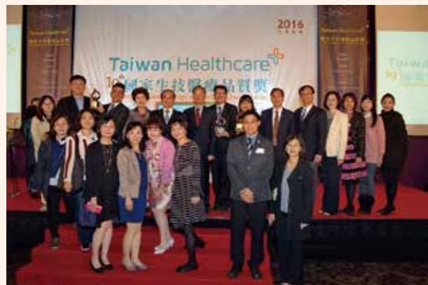
▲ SNQ 頒獎與 SNQ 委員及頒獎者合影