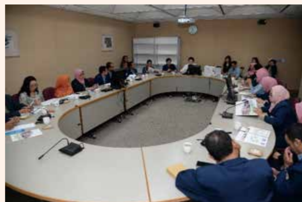
▲ 與印尼艾爾朗加大學研究所師生參訪交流會議 2