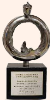
▲ 小兒心臟照護團隊 銀獎