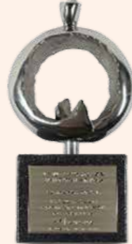
▲ 急診照護團隊 銀獎