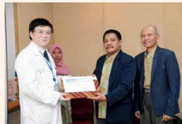
▲ 印尼醫院參訪代表頒發感謝狀