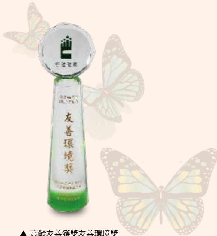
▲ 高齡友善獲獎友善環境獎