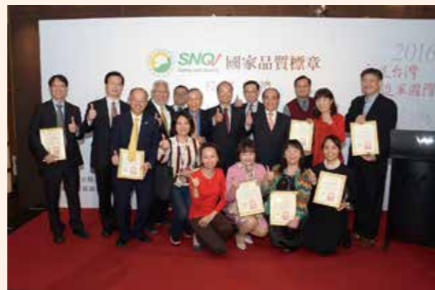
▲ SNQ 受獎團體與頒獎者合照