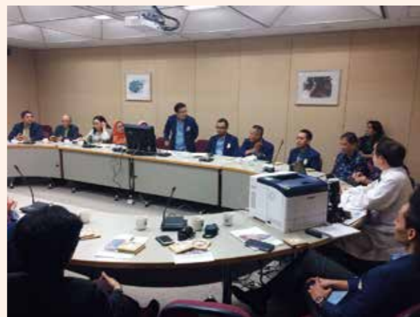
▲ 與印尼艾爾朗加大學研究所師生參訪交流會議 1