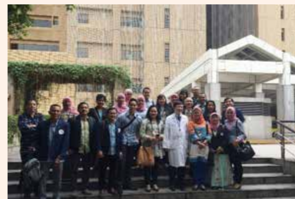
▲ 與印尼艾爾朗加大學研究所師生參訪合影