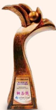
▲ 開發專利產品降低急診檢驗再檢率