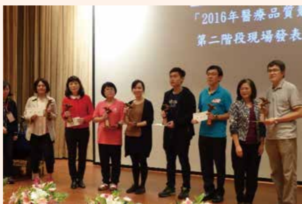
▲ 本院獲得 4 組團隊 (左邊 1-4 位) 獲得銅獎接受頒獎