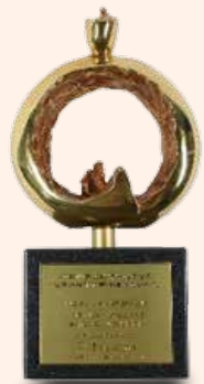
▲ 傷口照口護理照護團隊 金獎