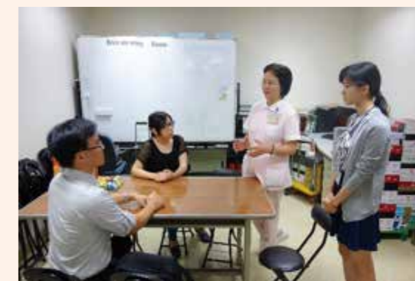
▲ 羅東博愛醫院參訪