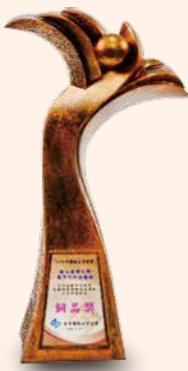
▲ 全方位提升呼吸器依賴病患肺部復健運動之成效與效益