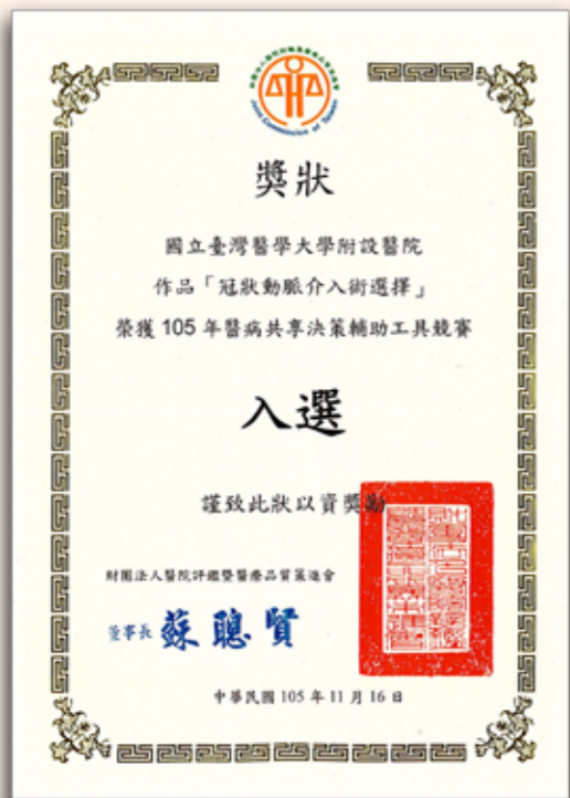
▲ 「從「心」出發 - 冠心病治療病人選擇權」榮獲 105 年醫策會「SDM 輔助工具競賽」入選