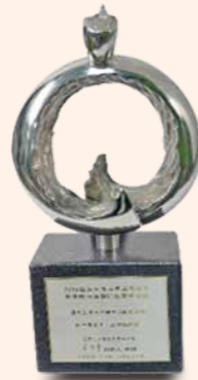
▲ 遠距醫療照護團隊 銀獎