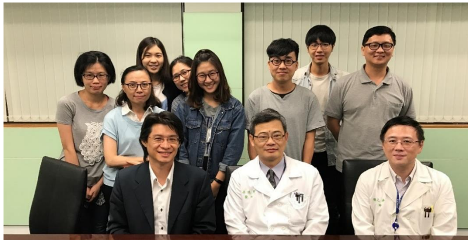
圖八、國立台北護理健康大學-健康事業管理系研究所全體大合照