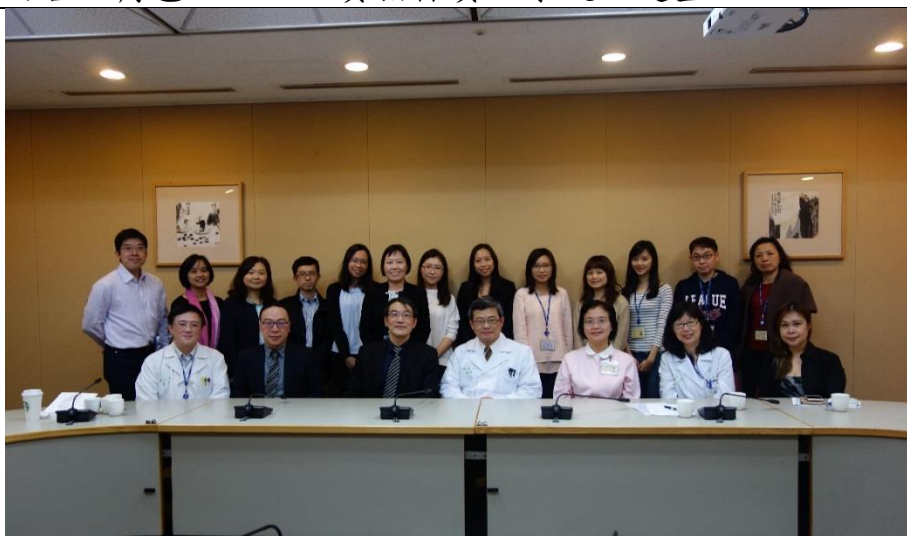
圖一、雙和醫院參訪全體大合照

(三)內容：與臺大醫院進行品質指標資訊系統標竿學習，瞭解品管中心相關工作內容及角色，以及品質指標資訊系統之建置。