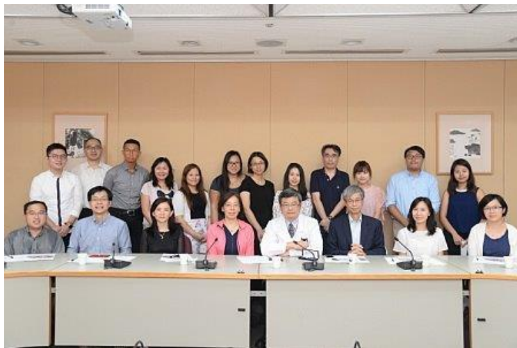
圖十八、香港中文大學與本院品管中心同仁大合照

(三)內容：醫院多媒體簡介、醫務管理交流、品管中心簡報、交流、參觀病友建言服務中心