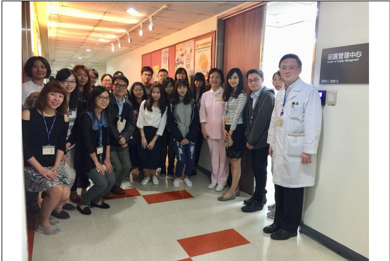
圖十一、輔仁大學公共衛生學系與本院品管中心全體大合照

(三)內容：了解臺大醫院品管中心工作內容及角色，如推行架構、病人安全網絡、品管教育與競賽活動推動策略與品質跨院合作機制等。品管中心業務簡介、品管教育與競賽活動推動策略、品質指標量測、病人滿意度調查、顧客建言服務。