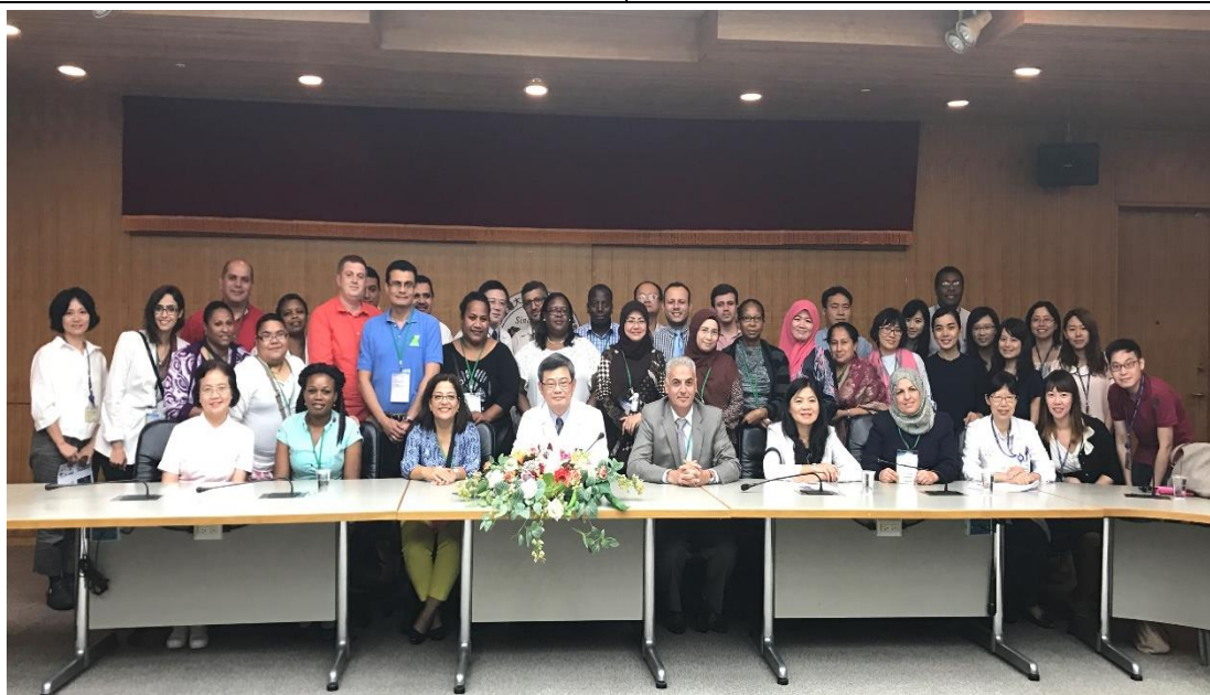
圖十六、本院品管中心與醫療品質管理研習班大合照