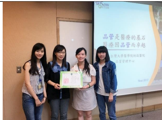
圖十、台南醫院致贈本院品管中心感謝狀