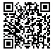
臺大醫院老人健檢 網路取號