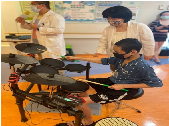
3/30 舉辦快閃音樂會，病童表演爵士鼓