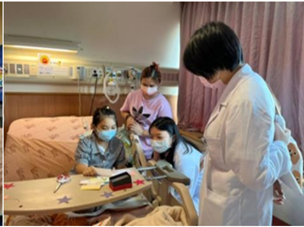
8/9 社工實習生為病童慶生，請病童寫下化療後即將掉髮的感受，與頭髮對話，期待頭髮新生的到來。