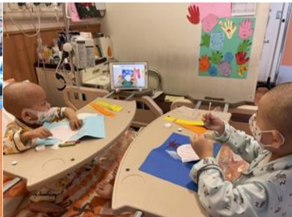
與光點兒童重症扶助協會合作，進行藝術教育課程，病童結伴視訊進行創作