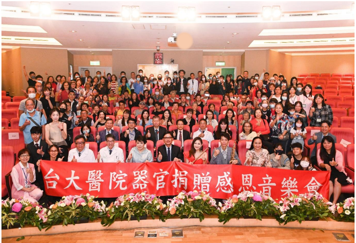
11/19 舉辦「與愛同行」器官捐贈感恩追思音樂會全體大合照