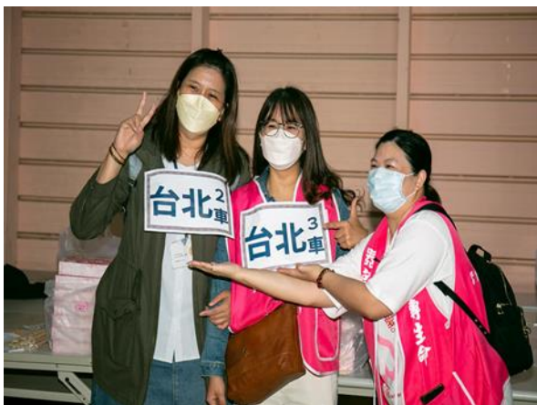
3/19 許玚仔社工師與器官勸募小組成員一同參與器官捐贈者家屬關懷活動