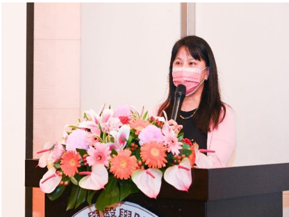
11/19 器官捐贈者家屬發表感言