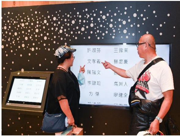
11/19 器官捐贈者家屬至大愛至善牆追思對捐贈者的無限懷念，