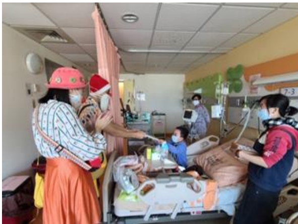
12/23 紅鼻子醫生於聖誕節親臨病房發放聖誕禮物盒，與病童及醫療人員互動