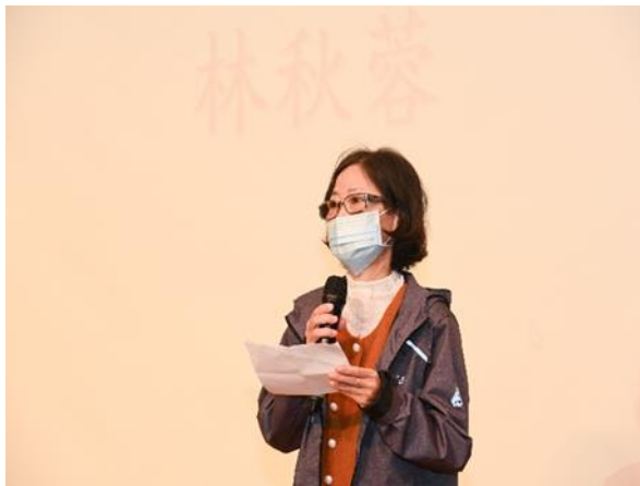
11/19 器官受贈者發表感言，感謝捐贈者大愛