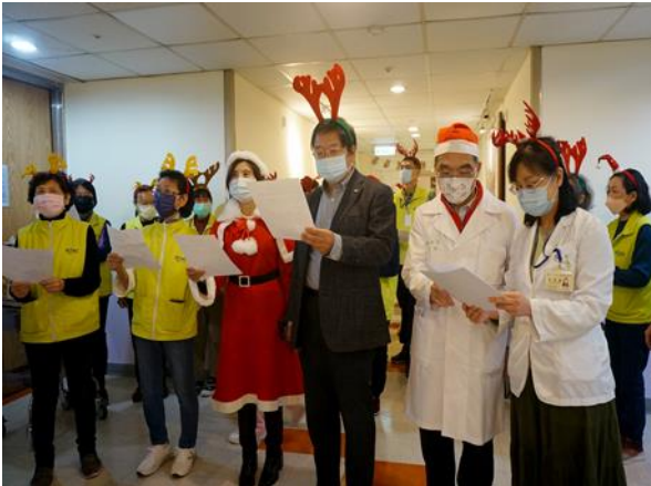
以歌聲「The Most Precious Gift」開啟佳節關懷活動