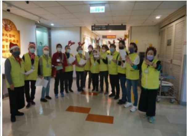
6A 病房志工夥伴參與活動