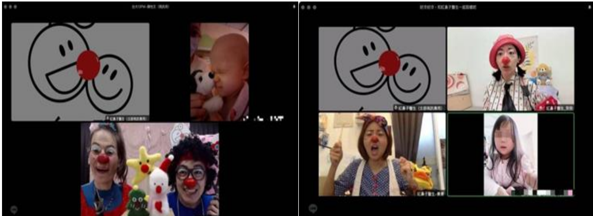
舉辦「穿越時空碰到你」：紅鼻子醫生透過視訊與病童互動

(4)12/25 與紅鼻子醫生舉行「聖誕公益禮盒送禮活動」，由紅鼻子醫生親臨病房發送聖誕禮物盒，總計有 32 位參與。