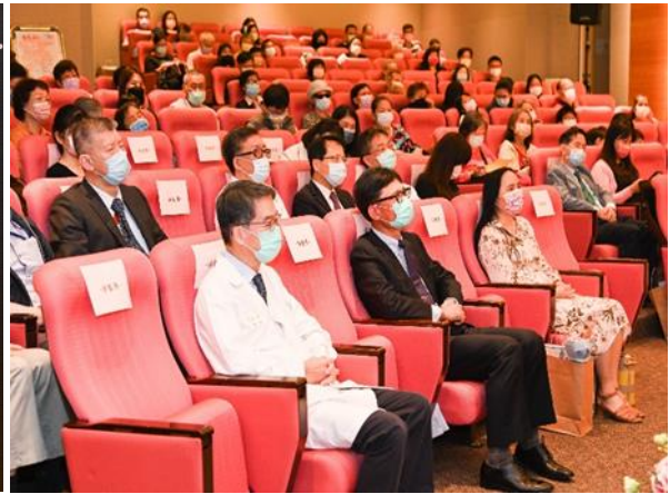
11/19 舉辦「與愛同行」器官捐贈者感恩追思音樂會邀請捐贈者家屬參與