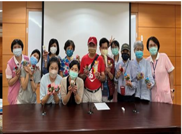
8/25 病友會活動後，病友一起分享作品合影