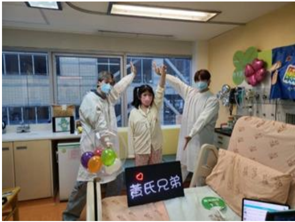
11/29 為病童舉辦圓夢活動，邀請其偶像 Youtuber 黃氏兄弟進行見面會