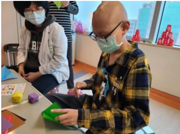
3/7 舉辦病童治療結束之畢業暨慶生同樂會，由其發揮擅長摺紙的技藝，教導來參加同樂會的病友及家長們摺紙。