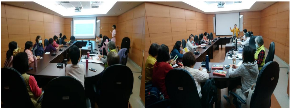
個管師介紹「認識乳癌及相關治療」