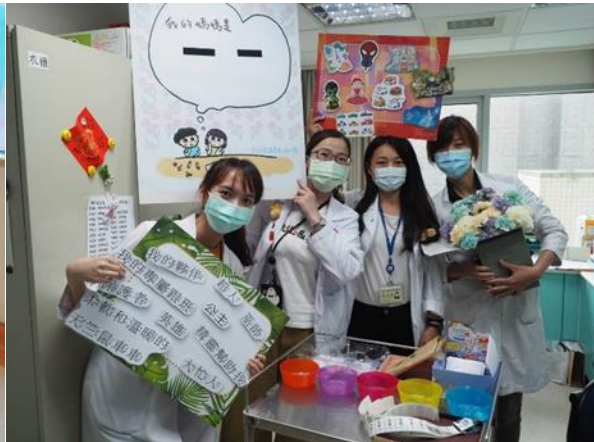
5/13 社工師及友善醫療個管師舉辦母親節活動