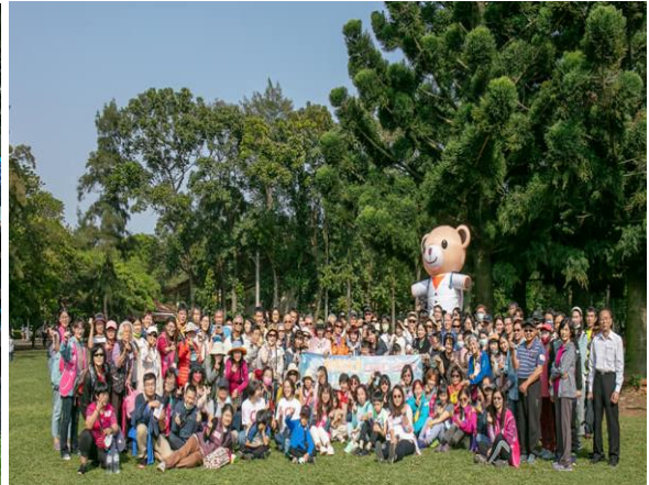
3/19 陪伴捐贈者家屬參與器官捐贈移植 3/19 捐贈者家屬於埔心牧場大合影 登錄中心舉辦之關懷活動