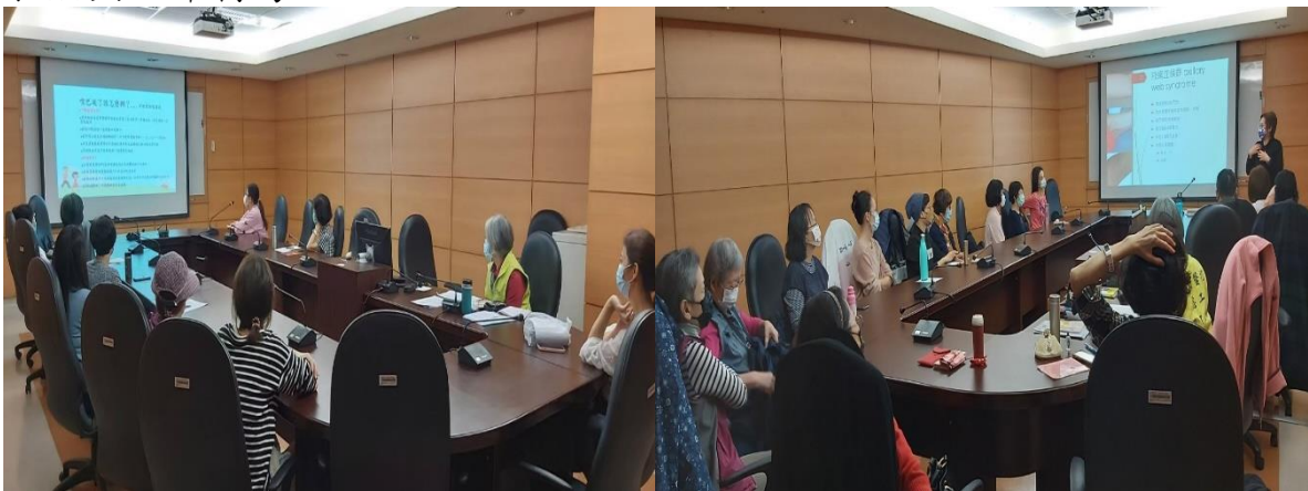
護理師帶領進行「勇於參與治療」

舉辦的主題包括：1、認識乳癌及相關治療；2、勇於參與治療(化療)；3、癌症者之營養－歡喜健康吃；4、與醫療人員互動－擴展生命；5、面對停經(或更年期)功課；6、不再一樣的生活，活力人生；7、生命對話，超越自我；8、術後復健運動，增進體能；9、信心強化－真善美追尋；10、乳癌與生命轉彎。