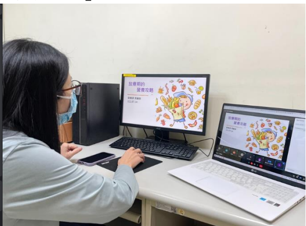
7/14 馮馨醇營養師線上直播演講「放療期的營養攻略」